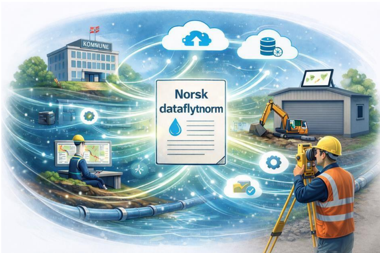
Bildet er generert av KI