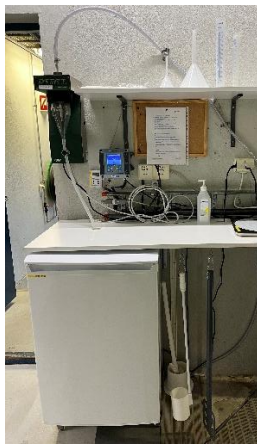
Automatiske prøvetakere plassert over frittstående kjøleskap.