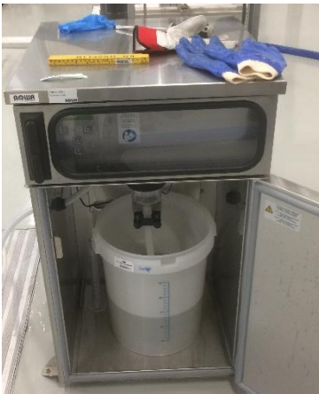
Automatisk prøvetaker med integrert kjøleskap

Det er viktig å velge en automatisk prøvetaker som passer for sitt prøvetakingspunkt og hensyntas hvor den skal plasseres i forhold til punktet. Sugehastigheten må være minst 0,5 m/s for å unngå partikkelseparasjon, og hastigheten påvirkes av hvor kraftig motoren til prøvetakeren er og avstanden mellom prøvepunktet og prøvetakeren (lengde på sugeslangen og løftehøyde). I tillegg er inngangen for slangen plassert noe forskjellig som også kan ha betydning i forhold til hvilken type som kan være best med tanke på plassering av sugeslangen. Slangen bør gå mest mulig vertikalt fra punktet og til prøvetakeren og horisontale strekker bør unngås. Det vil også være forskjeller på typene/modellene med tanke på justering av prøvevolum, rengjøring og vedlikehold.