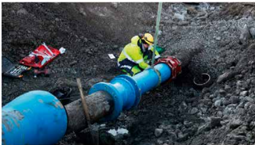
Store deler av Bodø var tirsdag formiddag uten vann som følge av bygging av den nye riksveien inn til byen.

Bodø kommune og Nordlandssykehuset satte tirsdag formiddag krisestab da store deler av Bodø ble uten vann.