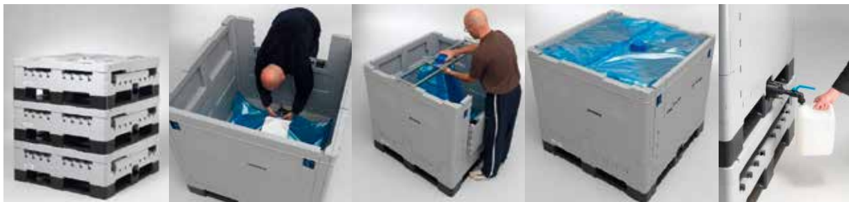
Figur 10: Montering av palletank type Combo Life ( http://kzhandels.no/ )

For bruk ute om vinteren finnes det elektriske varmematter og isolerende eller varmereflekterende overtrekk til palletankene. I begynnelsen av januar 2019 er det to norske leverandører av palletanker, poser og annet utstyr som er aktive på det norske markedet, Scanwater AS og KZ Handels AS.