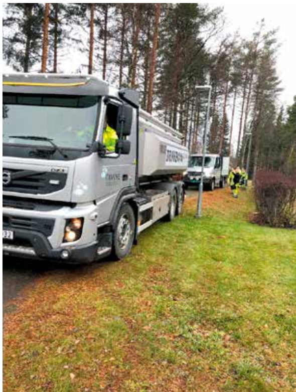
Figur 2: Krok løftbil med trykktank og bil med combitank.

Utstyret som er kjøpt inn brukes jevnlig i forbindelse med vannavslag og det er øvelser med medlemskommunene. NRV oppgir at øvelser er helt avgjørende for at NRV sine mannskaper skal være godt rustet, for at samvirket med kommunene skal fungere og at kommunene har personell med tilstrekkelig kompetanse. Erfaringsmessig er det ikke behov for så mye opplæring utover opplæring i hygiene i forbindelse med tapping av vann, og i montering av utstyr. Det har ikke vært behov for utstyret ved større nødvannshendelser og det har ikke blitt gjennomført øvelser med mange utdelingspunkter for vann, så det er lite erfaring med lang tids drift og logistikk for etterfylling av vann på vannposter. Men det er åpenbart at i en situasjon der de fleste palletankene til NRV er plassert ut, er det ikke tilstrekkelig med bare én 10 m 3 tank for etterfylling.