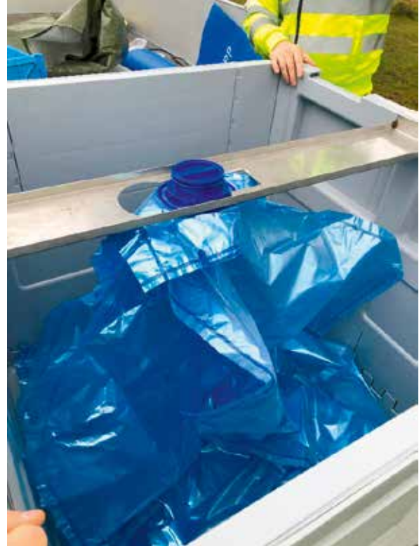
Figur 3: Tappekran monteres med hansker, steril innerpose monteres, øvelse:

Pallettankene må plasseres på et stativ/paller eller på annen måte løftes fra bakken for at det skal være mulig å tappe fra tankene. Hvis det er kaldt, kan tankene varmes opp og beskyttes, men er det fare for at krana fryser igjen. Derfor fjernes den ofte ved opphold i tappingen i kaldt vær. Det blir ofte en del søl og vanntap når en skal