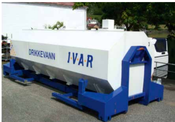
Figur 17: Tank for transport av drikkevann, 14 m 3

Tanken bør utstyres med pumpe og hydrofor for levering av vann. Pumpa bør gå på strøm fra aggregat, ikke på bilens kraftuttak. Det er ikke ønskelig med bil på «tomgang» nær bygninger. Hvis tanken også skal brukes til fylling av utplasserte tanker, bør den utstyres med pumpe med stor kapasitet mot lav løftehøyde. Denne kan drives av bilens kraftuttak. Det må vurderes om det er behov for varmeelement i tanken.