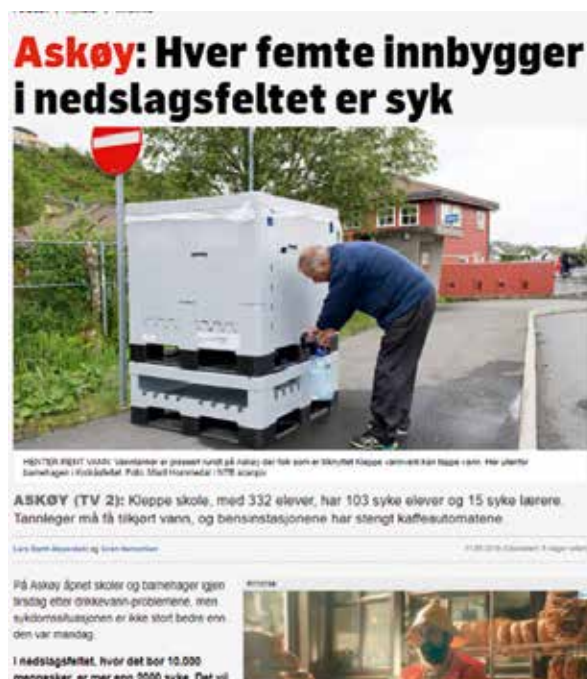
Faksimile fra TV2.no 11.6.2019

På Askøy i Hordaland har ca 10 000 personer tilknyttet Kleppe vannverk i juni 2019 fått forurenset drikkevann i krana. 2 000 personer er blitt syke. Kommunen iverksatte nødvannforsyning og utplasserte vanntanker på over 20 steder i vannverkets dekningsområde. På kommunens hjemmeside ble det lagt ut informasjon om hvor det er mulig å hente rent vann.