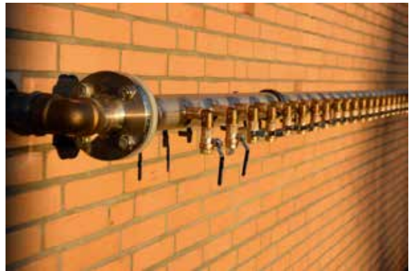
Figur 6: Tappearrangement for fylling av kanner eller vannposer.

Tilsigsområdene er ikke klausulert. Etter etablering er det prøvedriftsperiode, der brønnene testes og det tas prøver relativt ofte. Når en på den måten har fått oversikt over brønnenes kvalitet reduseres omfanget av prøvetakingen. Alt dette er etter samråd med Mattilsynet. Brønnene er da klar til å taes i bruk ved behov. Anleggene er komplette, uavhengige grunnvannsanlegg med nødstrømsaggregat. De er ikke knyttet til driftskontrollanlegget.