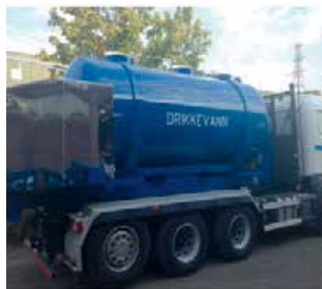
Figur 12: Tanker for transport av drikkevann 14 m 3.

De finnes i en rekke forskjellige utgaver. Vanligvis er det 7,5 – 15 m 3 ståltanker som kan fraktes på flakbil eller krokloftbil.