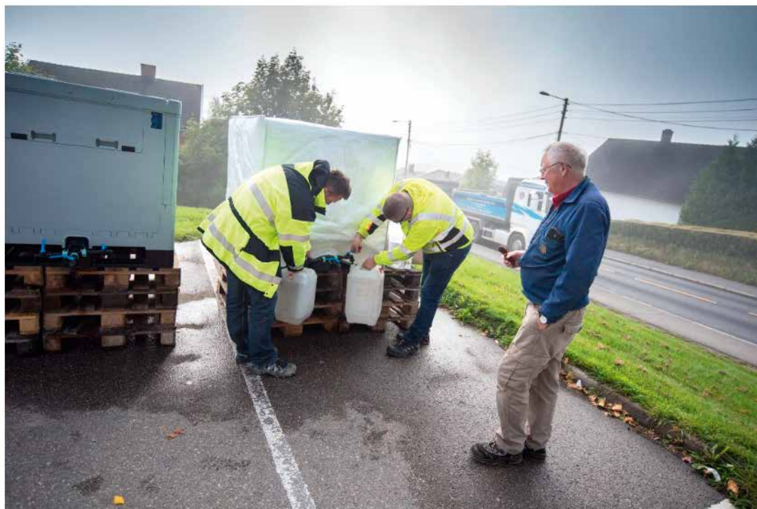
NØDVANN: Innbyggere uten vann kan hente forsyninger ved Mega-butikken på Skjetten. Foto: VIDAR SANDNES

Figur 16: Tank med nødvann fra NRV plassert utenfor Mega-butikken på Skjetten etter avstengning av vannet pga. ledningsbrudd. Faksimile fra nettutgaven av Romerikes Blad, rb.no.