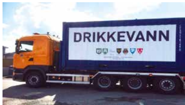
Figur 15: Container med palletanker

Containeren bør pakkes slik at det man trenger først eller oftest kan tas ut uten at hele container må tømmes. Det er viktig å ha kontroll med at alt utstyr kommer tilbake til containeren.