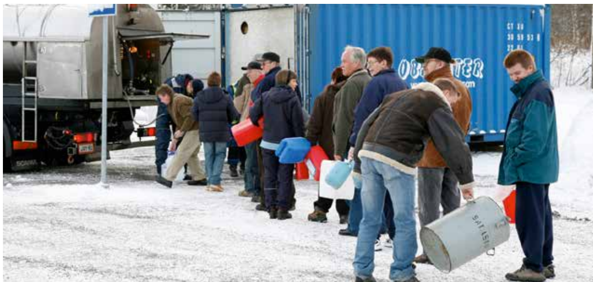
Figur 7: Innbyggere i Nokia henter vann fra tankbil etter at kommunens distribusjonsnett ble forurenset med avløpsvann.

måtte forsynes med nødvann i opptil 12 døgn. Svært mange ble syke og mange har langvarige plager etter hendelsen.