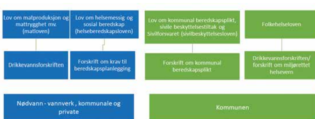
Figur 1: Regelverk vannforsyningsberedskap – oversikten er ikke uttømmende.

I samme forskrift stilles det i § 9 krav til leverings-sikkerhet og nødvann: