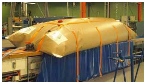
Figur 14: Putetank produsert i Norge (Protan.no)

Putetanker leveres i størrelser fra 100 liter opp til 20 m 3 . Tankene tar ikke mye plass under lagring, og de er rimelige enn ståltanker. De er vanligvis ikke utstyrt med ekstrafunksjoner, så pumpe, aggregat mv. må anskaffes separat hvis det er behov for det.