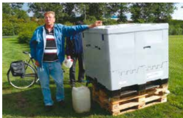
Figur 0: Følg anbefalingene i denne rapporten og du får fornøyde kunder.

Norsk Vann har bedt Helse- og omsorgsdepartementet (HOD) avklare ansvarsgrensen mellom kommunen (rådmann eller beredskapssjef) og vannverket. En slik avklaring foreligger ikke ultimo august 2019 når prosjektrapporten går i trykken. Ved utarbeidelse av planer for nødvannforsyning er det viktig at kommunen og vannverket har et godt samarbeid. Vannverket må gjøre en realistisk vurdering av hvor mye det er mulig å gjøre med egne ressurser. Eksempelvis vil drift og vakt hold ved utplasserte stasjoner, og distribusjon av nødvann til personer som ikke kan hente vannet selv normalt ligge utenfor det vannverket har kapasitet til. Det er viktig at det utarbeides klare avtaler om ansvarsdeling mellom vannverket og kommunens beredskapssjef. Det må holdes realistiske øvelser hvor en tester om planene fungerer.