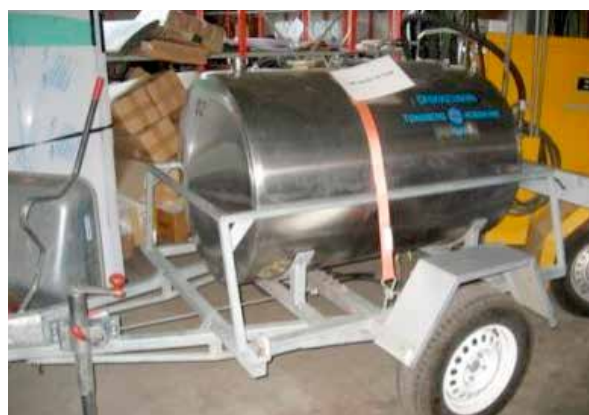
Figur 11: Liten tank på tilhenger.

Tanker i stål, GRP eller PE kan stå fast montert på en tilhenger. De kan fraktes med liten bil og er klar til bruk rett fra lager. Mange kommuner har et lite antall slike til bruk ved planlagte driftsavbrudd eller mindre ledningsbrudd. En slik tank kjøres ut full og kan etterfylles på tappestedet eller transporteres bort for fylling. Tanken kan gjerne stå klar, fylt med drikkevann. Dette vannet bør byttes ut etter noen måneder. Tankene bør sjekkes innvendig og desinfiseres med klor årlig.