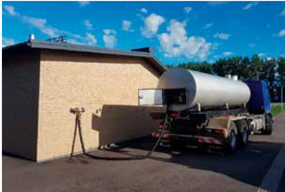
Figur 5: Fylling av tankbil, grunnvannsanlegg plassert i varmesentral.