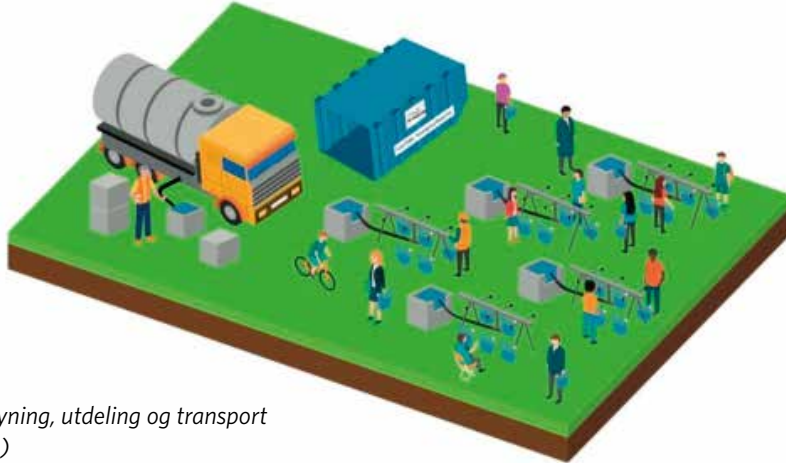
Figur 9: Nødvannforsyning, utdeling og transport (skisse fra Scanwater)

I dette kapittelet omtales spesialutstyr for nødvannforsyning. For nødvannforsyning direkte fra grunnvannsbrønner i området benyttes ikke spesialutstyr ut over eventuelt poser, så dette er ikke nærmere omtalt her.