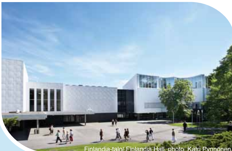
Finlandia-talo/ Finlandia Hall

Up-to-date-information om konferensen kommer att finnas på konferensens hemsida www.vvy.fi/ndwc2014 .